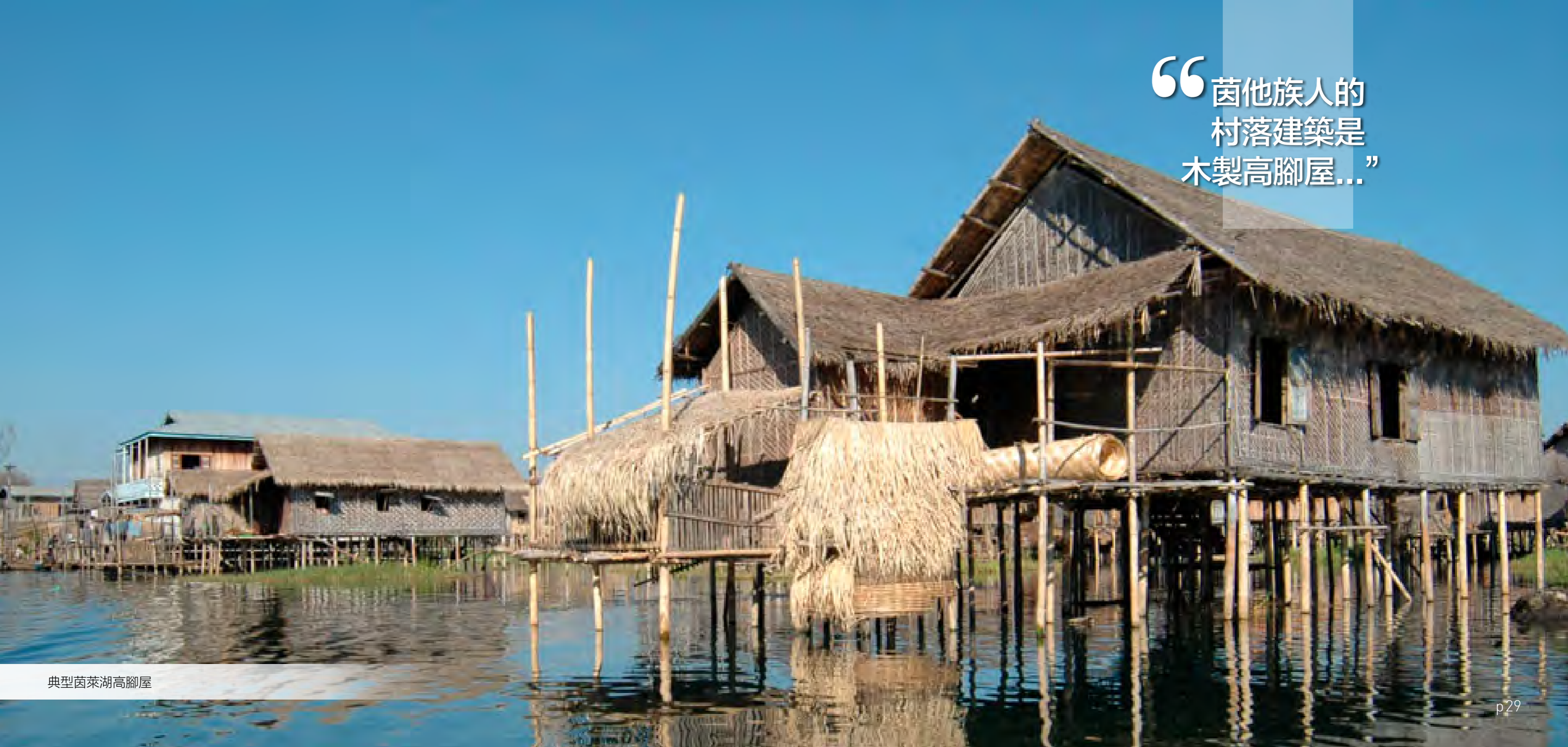
典型茵萊湖高腳屋